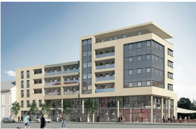
Das Postareal in Kehl am Rhein (Visualisierung: LEINBACH + BARTELS Architekten GmbH)

Sekundengenaue Abrechnung mit intelligenten Stromzählern von Discovergy